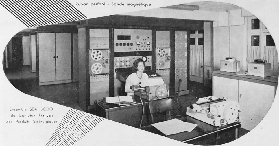
Ensemble SEA 3030 du Comptoir Français des Produits Siderurgiques