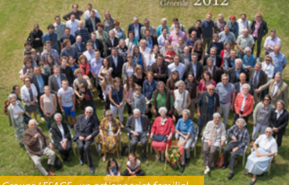
Groupe LESAGE : un actionariat familial