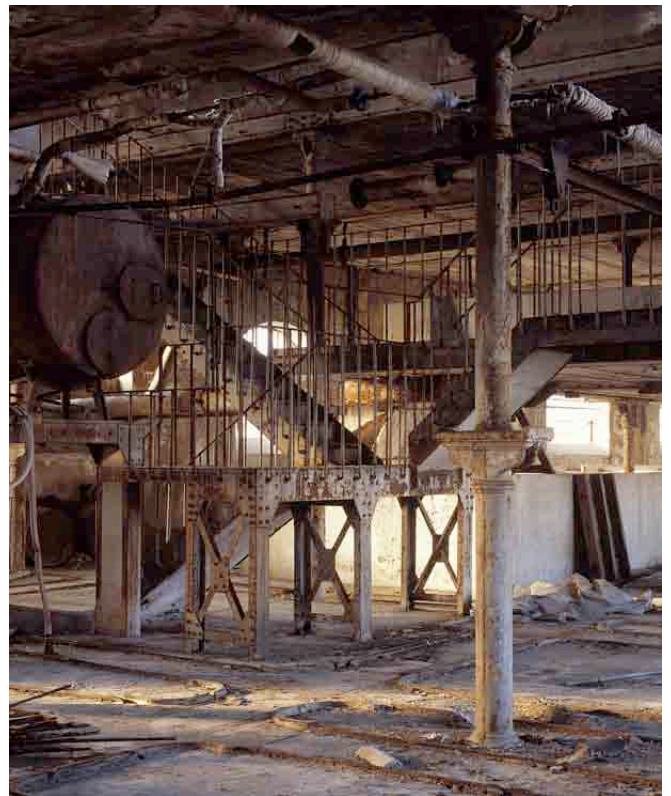
Papeterie d'Essonnes, intérieur de la « nouvelle usine » (1884-1889)