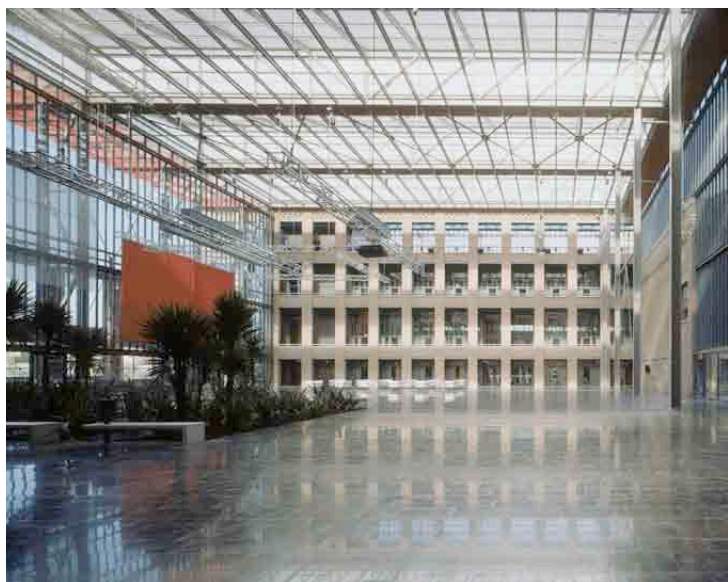
Euratechnologies – Usine Le Blan-Lafont (Lille) © Borssy & Associés.

Au travers de trois exemples de reconversion (les filateurs Le Blan Lafont à Lille, le Pavillon de l'Eau dans les Usines d'Auteuil, la Maison des Métallos à Paris), on verra comment le travail de rénovation contemporain se fonde sur la compréhension des conceptions croisées techniques et architecturales des concepteurs de l'époque. Sur cette complémentarité essentielle reposent l'usage, la forme et l'espace.