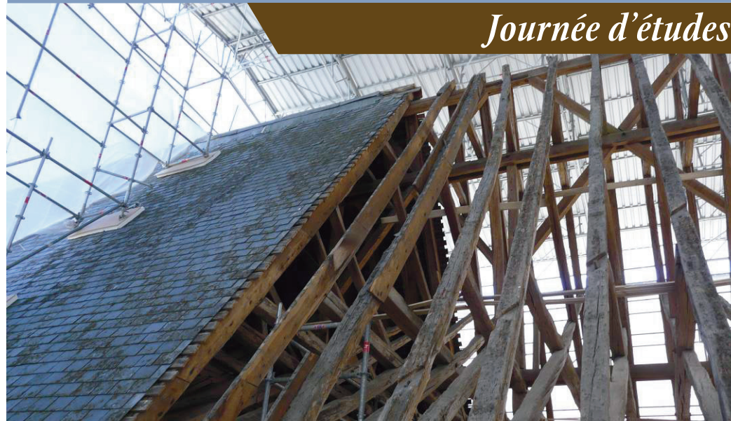
CHARPENTE ET TOITURE DE LA CATHÉDRALE DE BOURGES EN COURS DE RESTAURATION