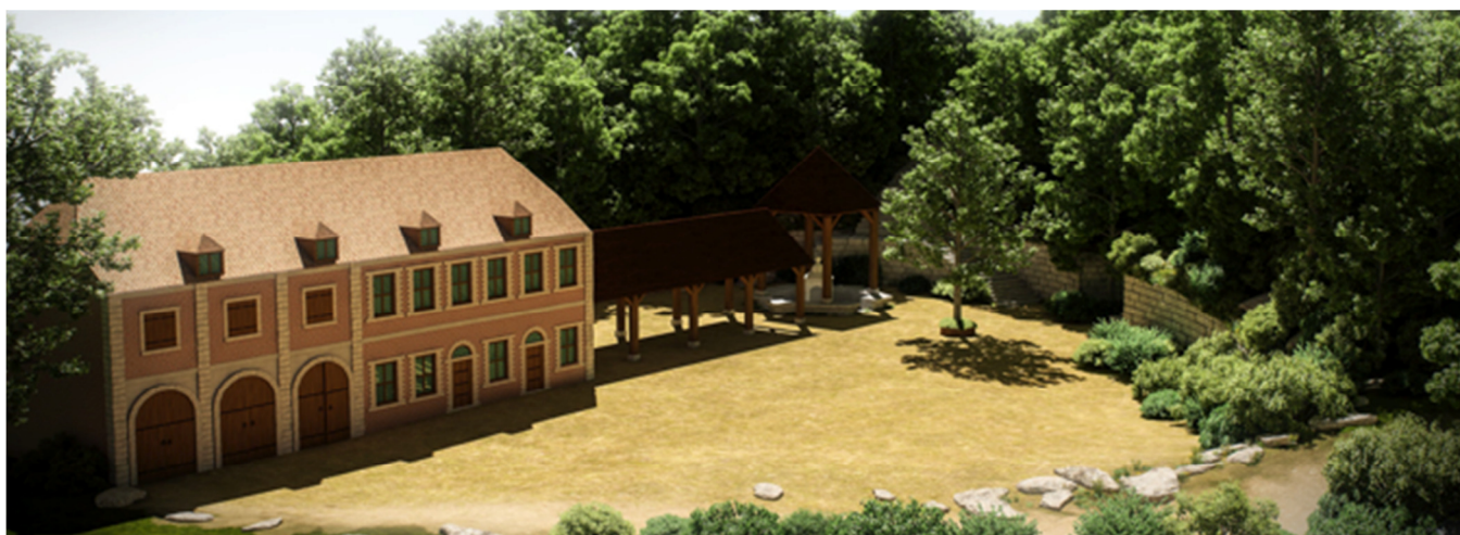
Restitution 3D de la ville de SPA et de ses environs au cours de la seconde moitié du XVIIIème siècle. ©

http://www.universite-paris-saclay.fr/fr/formation/master/m2-histoire-economique-sociale-hes