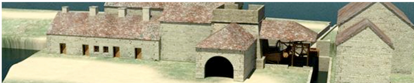
Reconstitution en 3D du haut fourneau de Marcenay, Bourgogne.