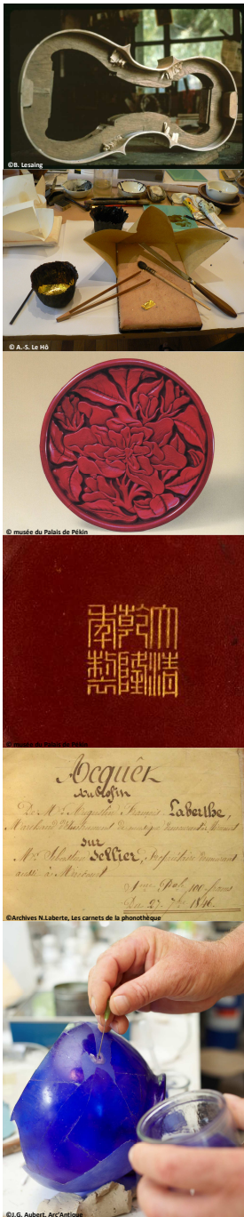
Table ronde 2 Confronter les espaces temporels et géographiques différents

L'émergence des pratiques consuméristes à la période moderne a accompagné la circulation accrue d'objets précieux et de collection, leur reproduction puis l'adaptation pour des clientèles se diversifiant (des consommations curiales aux biens de demi-luxe voire à des marchés larges). Nous souhaiterions ici aborder les réseaux d'échanges et d'influence entre Extrême Orient et Europe à travers différents traitements de surface (émaux, laques, glaçures). Comment y a-t-il eu diffusion et perdurance des savoirs, résistance des procédés anciens et/ou concomitance de procédés ? Quel est le lien entre les modes de production et de consommation ? De quelle manière l'usage des matériaux et leurs adaptations/substitutions dépendent tant de contextes économiques et politiques que de ressources localisées. La nécessité de travailler sur des ensembles (d'objets) questionne parfois la faible représentativité des échantillons et des traces écrites.