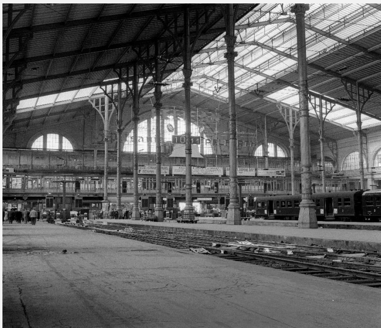
Les quais de la gare de Paris-Nord.