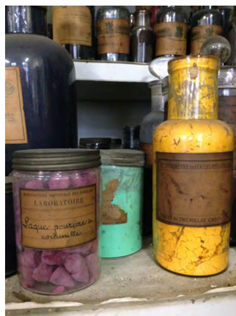
Labo-Chevreul-1 et 2 : Atelier de teinture (laboratoire de Chevreul), Paris, Mobilier national ©M.-A. Sarda, 2015 Dyeing workshop (the Chevreul laboratory), Mobilier National, Paris ©M.-A. Sarda, 2015

A partir de recherches inédites et de sources collationnées depuis 2015 par les équipes du Mobilier national et mises à la disposition des chercheurs, différentes thématiques pourront être abordées durant ces journées :