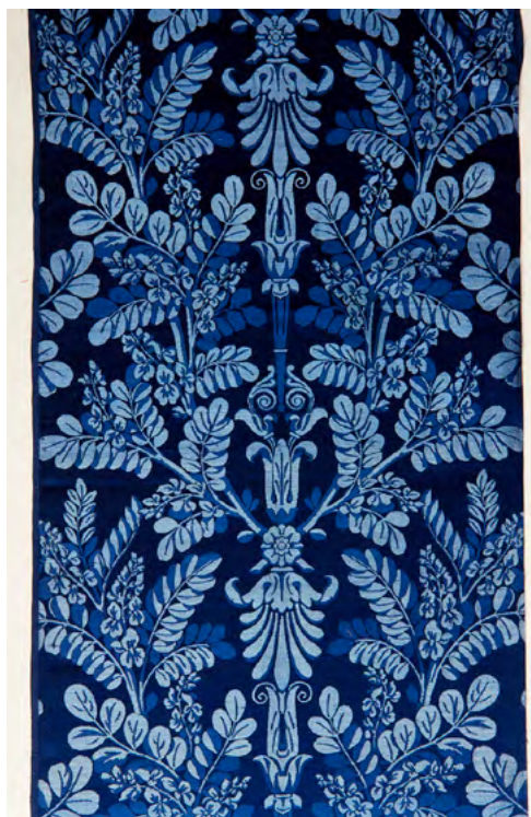
Damas teint à l'indigo, Grand frères et Cie, Lyon, 1811-1813 Damas dyed with indigo, Grand Frères et Cie, Lyon, 1811-1813

The conference will be held both online and face-to-face, requiring particular care with regard to the way in which the discussions are conducted. We will ask participants to focus on their statements very precisely for fifteen minutes to optimise the discussion times. Participants may communicate in French or in English.