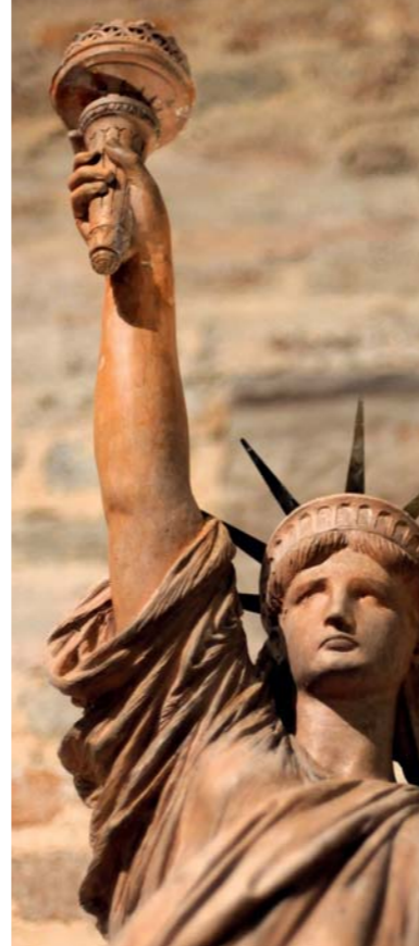
• La statue de la Liberté, New York - 1886 • Daniel Dupuis, l'exposition universelle de 1889 à Paris, Musée d'Orsay, Ville de Paris.

Maison du Peuple, place de la Résistance, Belfort.