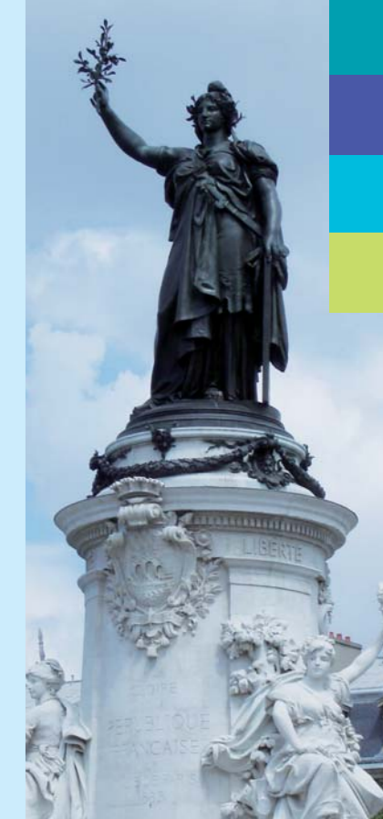
• La place de la République, Paris - 1883 • Le Départ des volontaires, Arc de triomphe Paris - 1792